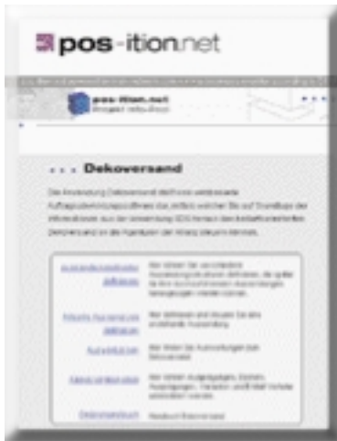
oben: Anmeldemaske auf www.pos-ition.net zum Schaufenster- Dekosystem.

Die Allianz-eigene Point-of-Sale Datenbank dahingehend zu erweitern, dass neben dem Supply-Chain-Management für die Ausstattung von Außenwerbbeanlagen alle Elemente für die Schaufensterwerbung internetbasiert