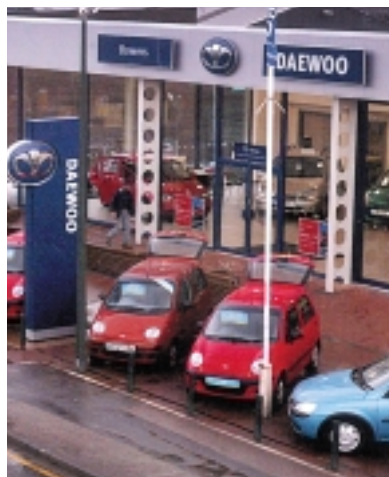
Beispiel eines umgerüsteten Deawoo-Autohauses.

Das Projekt beinhaltet neben der Ausstattung der GM-Daewoo Point-of-Sales mit Corporate Design Elementen auch die Fassadenrenovierung mit Sanierungsflächen in bisher 19 europäischen Ländern. Das dazu erforderliche Multi-Projekt-Management stellt hohe Anforderungen an Mitarbeiter, Technik und IT-Lösungen.