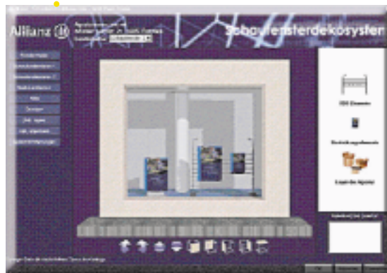
Integrierter 3D-Konfigurator Allianz

Der Zugang zum internet-basierten Steuern des Schaufenster-Deko-Systems erfolgt über das Portal www.position.net der imm-network