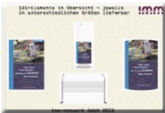
rechts: Übersicht SDS- Elemente

gesteuert und digital verwaltet werden. Das ist die Aufgabenstellung an die imm-network.