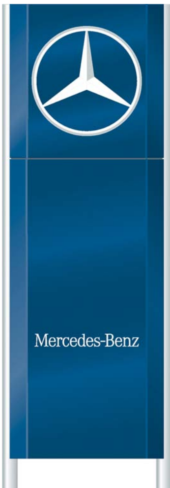
Bestellvorschlag bzw. Bestellbestätigung der Individualbeschriftung